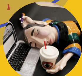
《疲累的男子》陶藝 (2015) *被教大校長納為收藏品